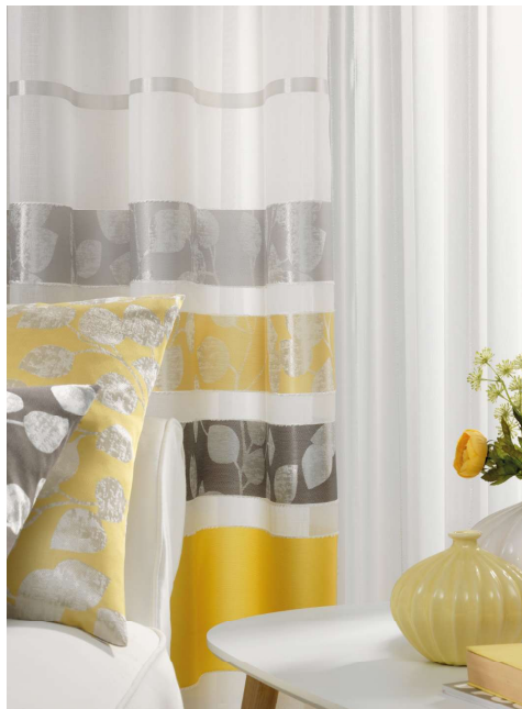
Dekostoffe in sommerlichen Farben mit eingewebten Glanzgerne, Querstreifen und Stores mit Effektgerne – die Artikelserie „Lanuna“ aus der „Summer Vibes“-Kollektion weckt Assoziationen an die warme Jahreszeit.

beispielsweise witzige Fransen, sind die Detail-Highlights, die das Verkaufen leicht machen.