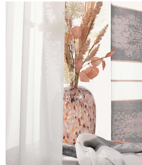
Schönheiten: Artikelserie „Belissa“ in Rosé und Wollweiß aus der Kollektion „Pure Elegance“.

Kunden mit exquisitem Geschmack sollten beim Raumausstatter in dieser Kollektion fündig werden. Denn „Pure Elegance“ bietet alles auf hohem Niveau: elegante, pastellige Farben wie Rosé, Grün und Taube, hochwertige Scherlis, Effektgerne, eine sehr aufwendige Motivgestaltung im Detail. Und das alles in einer sehr breiten Produktaufstellung: Allover-Dekos mit Scherli oder Struktur, Querstreifen, Stores und Flächenvorhänge aus Scherlistoffen.